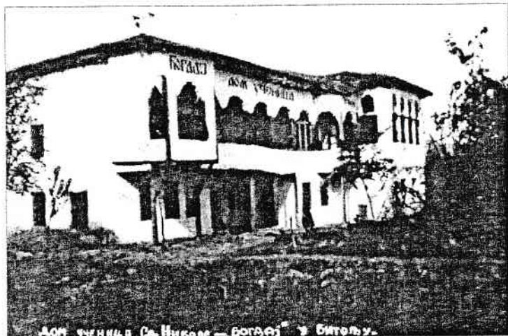
Clădirea orfelinatlui „Bogdai” de la Bitolia, anul 1940.